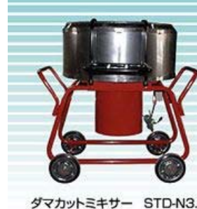
岡三機工社製 モルタルミキサー 《ダマカットミキサー4.5型》

輸送能力 水平90m 垂直30m 動力 3.7kW 200V インバーターモートル 吐出能力 0.1~2.7m 3 /h 吐出圧 Max 3.5MPa(35kg/cm 2 ) 寸法 700(W)×1,300(L)×740(H)mm 重量 2,608.6N(266kg) 定格インバーター出力 定格16.4A 保有台数 1台