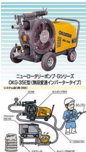
岡三機工社製 OKG-35E グラウトポンプ 《モルタル圧送吹き付け機械》

輸送能力 水平90m 垂直30m 動力 3.7kW 200V インバーターモートル 吐出能力 0.1~2.7m 3 /h 吐出圧 Max 3.5MPa(35kg/cm 2 ) 寸法 700(W)×1,300(L)×740(H)mm 重量 2,608.6N(266kg) 定格インバーター出力 定格16.4A 保有台数 1台