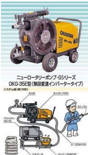
岡三機工社製 OKG-35E グラウトポンプ 《モルタル圧送吹き付け機械》

輸送能力 水平90m 垂直30m 動力 3.7kW 200V インバーターモートル 吐出能力 0.1~2.7m 3 /h 吐出圧 Max 3.5MPa(35kg/cm 2 ) 寸法 700(W)×1,300(L)×740(H)mm 重量 2,608.6N(266kg) 定格インバーター出力 定格16.4A 保有台数 1台