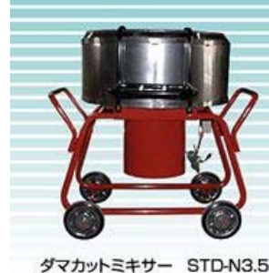
岡三機工社製 モルタルミキサー 《ダマカットミキサー4.5型》

輸送能力 水平90m 垂直30m 動力 3.7kW 200V インバーターモートル 吐出能力 0.1~2.7m 3 /h 吐出圧 Max 3.5MPa(35kg/cm 2 ) 寸法 700(W)×1,300(L)×740(H)mm 重量 2,608.6N(266kg) 定格インバーター出力 定格16.4A 保有台数 1台