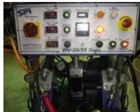
ガスマーHV-25 超速硬化ウレタン吹き付け機械

プライマリーヒーター 8000W ホース長さ 90m 最大温度 100℃ 最大圧力 20Mpa 外形寸法 1300L×850W×1200H 電源 三相 /15KW/200V/60Hz/50A