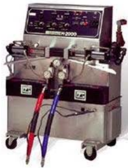
ガスマーH-2000 超速硬化ウレタン吹き付け機械

プライマリーヒーター 6000W ホース長さ 90m 最大温度 100℃ 最大圧力 20Mpa 外形寸法 1300L×850W×1200H 電源 三相 /15KW/200V/60Hz/100A 保有台数 1台