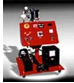
グラスクラフトMINI3 超速硬化ウレタン吹き付け機械

プライマリーヒーター 16000W ホース長さ 90m 最大温度 100℃ 最大圧力 20Mpa 外形寸法 1300L×850W×1200H 電源 三相 /15KW/200V/60Hz/100A