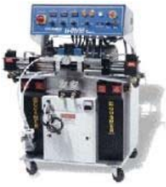
ガスマーH-25 超速硬化ウレタン吹き付け機械

プライマリーヒーター 16000W ホース長さ 90m 最大温度 100℃ 最大圧力 20Mpa 外形寸法 1300L×850W×1200H 電源 三相 /15KW/200V/60Hz/100A